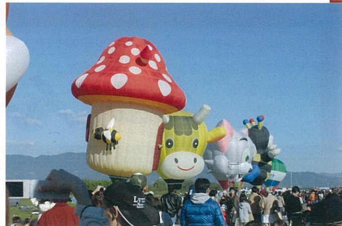
いろいろな形をしたバルーンがたくさんありました！ 一斉に飛び立つ景色がとても綺麗でした！！