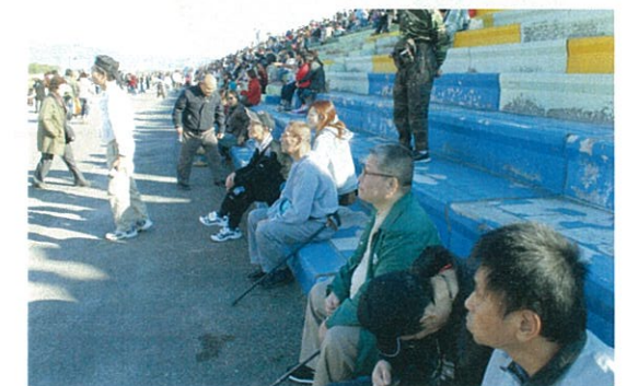
～佐賀県佐賀市嘉瀬川河川敷にて～

社会福祉法人 年輪福祉会 ・ 障害者支援施設 年輪の園 〒833-0002 福岡県筑後市大字前津1965-1 TEL:0942-53-8211 FAX:0942-52-0652