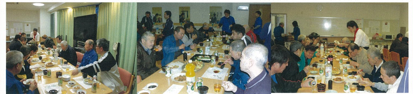
お寿司、おでん、お汁粉、フルーツポンチ、みんなたくさん食べました！！