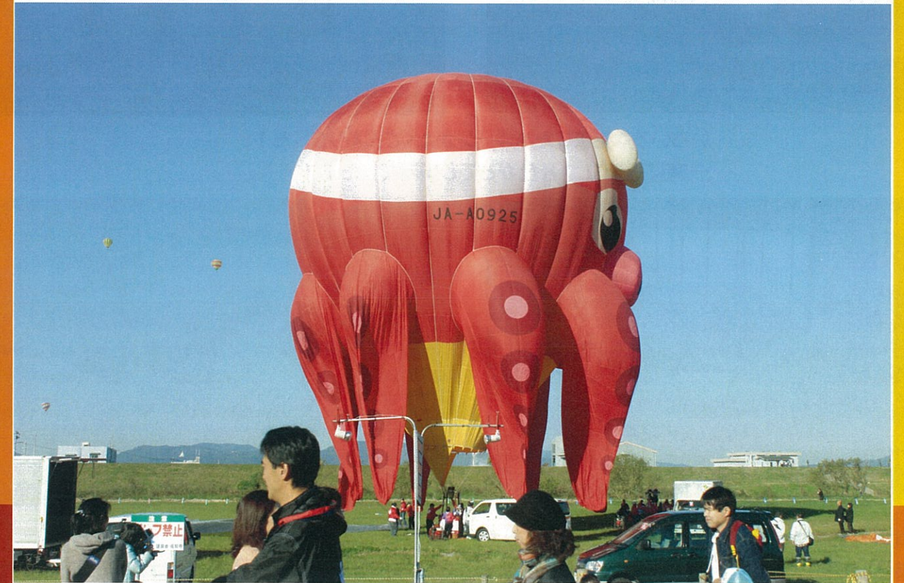
写真クラブ 2010佐賀インターナショナルバルーンフェスタ 2010.11.3