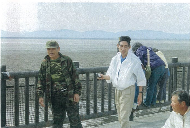
遠くに見えるは多良岳です(鹿島方面)。