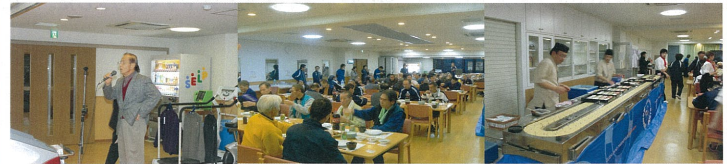
理事長のあいさつではじまりです。