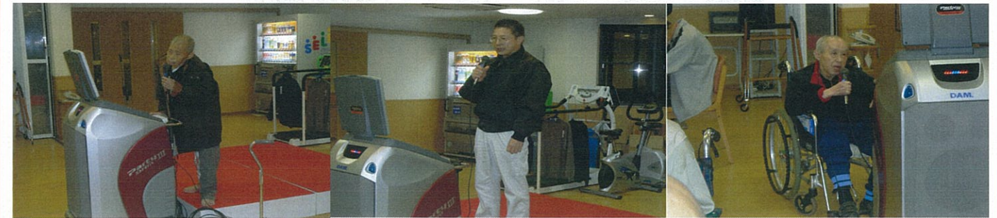
熱唱が続きます、マイクの取り合いでなかなか終わりません