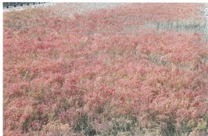
これが海の紅葉シチメンソウ(塩生植物)