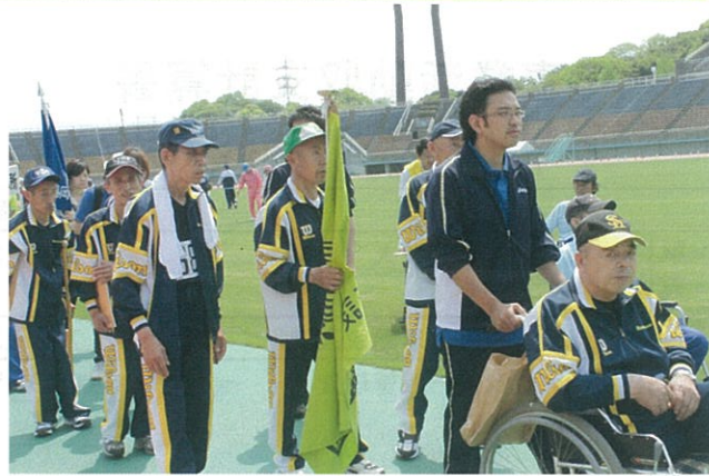
第49回福岡県身体障害者体育大会H23.5.8