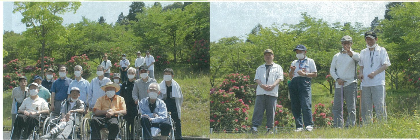
グリーンピアまでドライブ H23.5.18