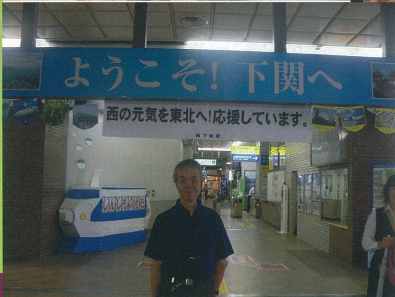
新幹線で一路下関へ、約40分の短い間でしたが、とても快適でした。