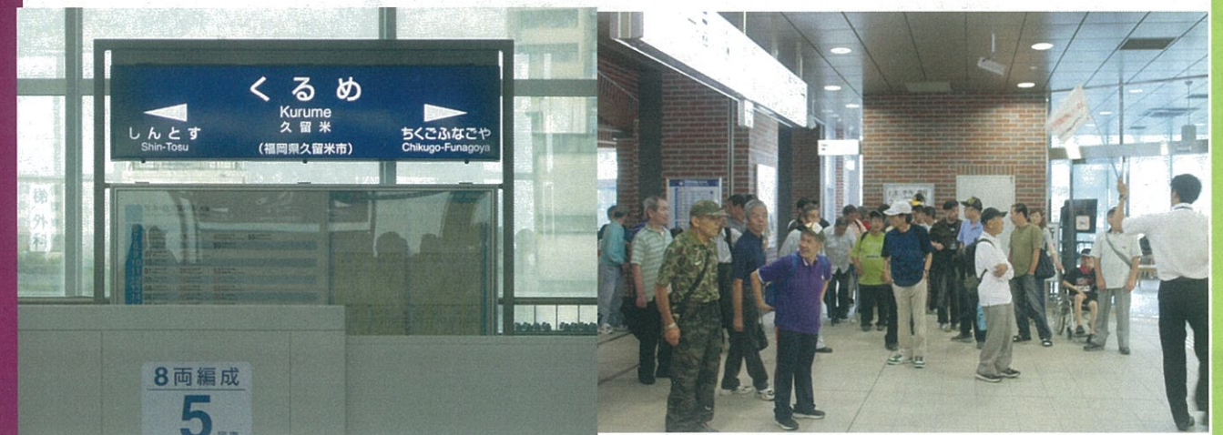
バスで久留米駅へ到着です。

社会福祉法人 年輪福祉会 ・ 障害者支援施設 年輪の園 〒833-0002 福岡県筑後市大字前津1965-1 TEL:0942-53-8211 FAX:0942-52-0652