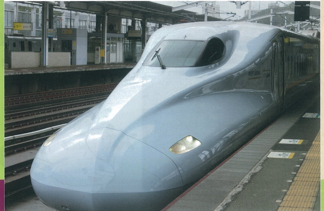
新幹線で下関へ日帰り旅行 2011.9.3