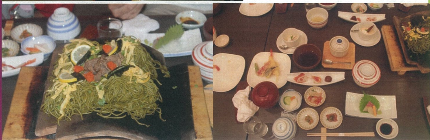
昼食は川棚温泉名物「瓦そば」を美味しく頂きました。